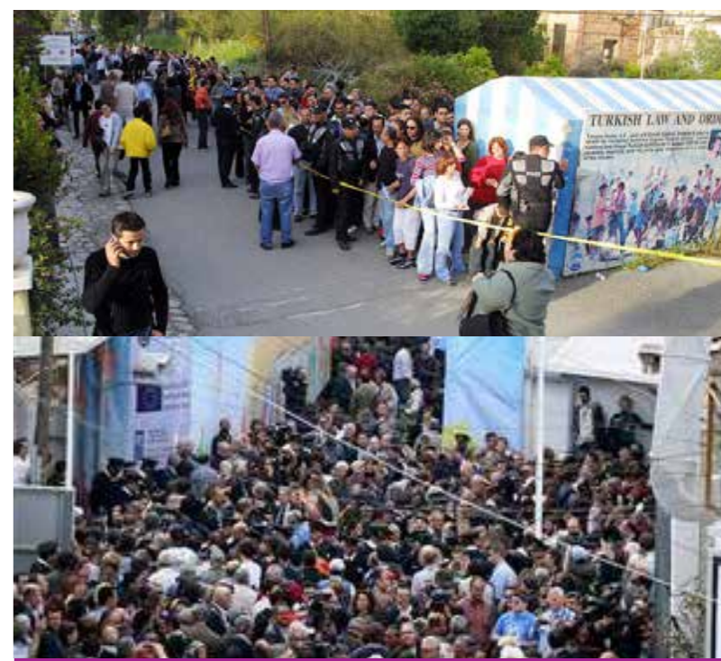
Το άνοιγμα των οδοφραγμάτων, 23 Απριλίου 2003, Άνοιγμα Λήφρας, 3 Απριλίου 2008